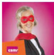
CSMR Couverture supplémentaire maladie des retraités