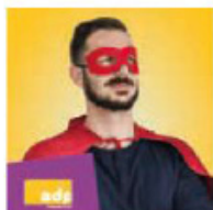
ADP Assurance de prêt immobilier