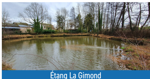
Étang La Gimond