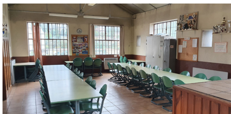
Salle Saint-Julien à Saint-Chamond