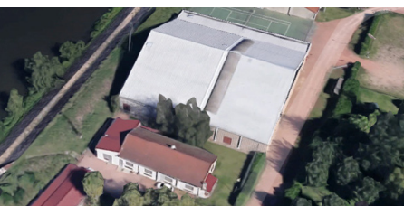
Ensemble sportif Transval à Roanne