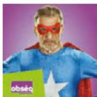
OBSÈQ Couverture obsèques