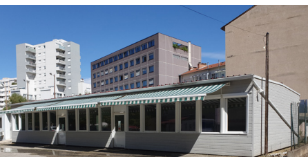
Stade Jean Civier à Saint-Étienne

Contacte le secrétariat des élus à la CMCAS pour demande de disponibilité des locaux et/ou réservation.