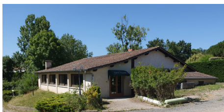
Auberge Le Crin Blanc à Lézigneux