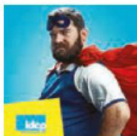
IDCP Prévoyance complémentaire